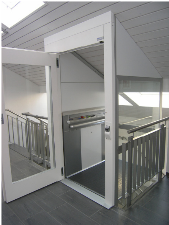
Liftschacht unter Dachschräge eingepasst, nachträglicher Einbau