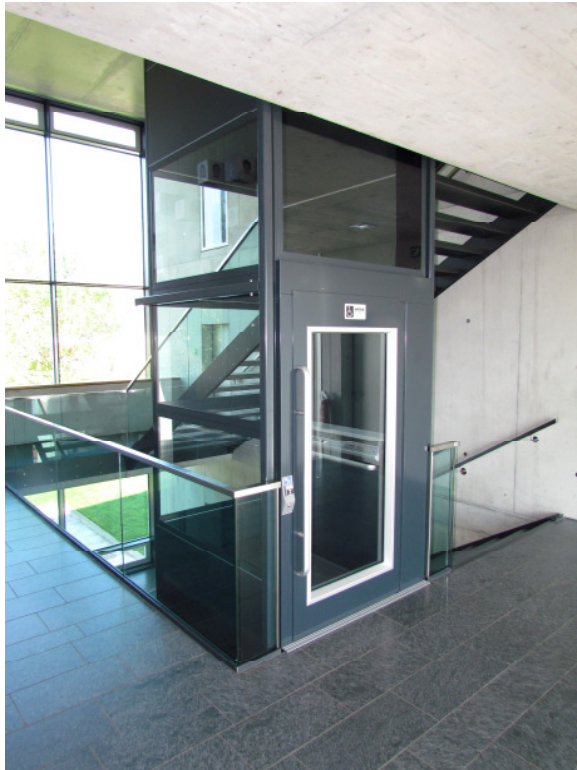
Nachträglicher Einbau im Treppenhaus eines Schulhauses