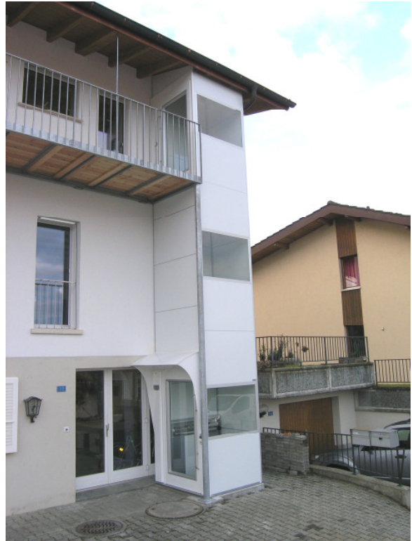
Zugang zu oberer Wohnung über den Balkon